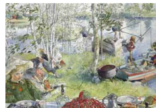
図3: カール・ラーション《ザリガニ捕り》1890-1899年頃 スウェーデン国立美術館 東京都庭園美術館ほか『スウェーデンの国民画家 カール・ラーション展』1994より転載

念願叶って、ラーション記念館を訪れた私であったが、一つ悔やんだことがある。有名な絵師の作品はともかく、浮世絵版画について知らなさすぎると痛感したのだ。私が当時わかったのは写楽だけだった。海外でもいまだに根強い人気を誇る浮世絵だが、果たしてどのくらい我々日本人の身近にあるのだろうか。現在、夏の特別展に向けて準備を進めているが、会期終了後、あの錦絵の飾られた書斎を再度訪れることができたなら、新たな気づきを見いだせるのではないかと密かに思っている。