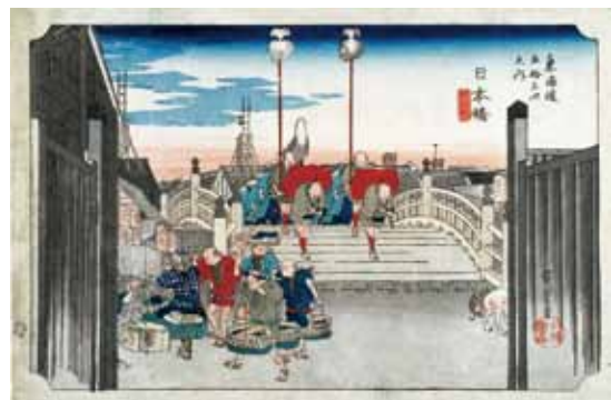
図1: 歌川広重《東海道五十三次之内 日本橋 朝之景》