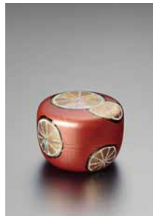
《平棗「みかん」》2001年 本館蔵

岡山ゆかりの漆芸作家は決して多くはありませんが、このたびの寄贈を受け、漆芸表現の可能性に挑む小松原の作品から次に続く作家が出てくることを期待しています。