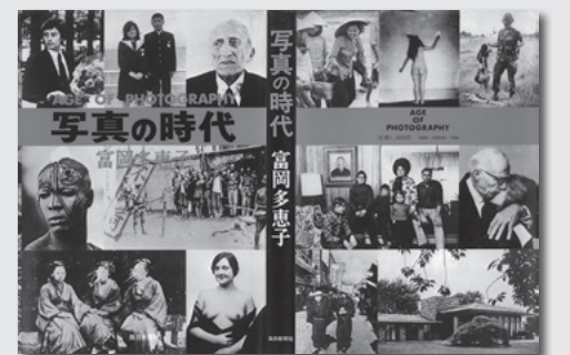
毎日新聞社刊行本