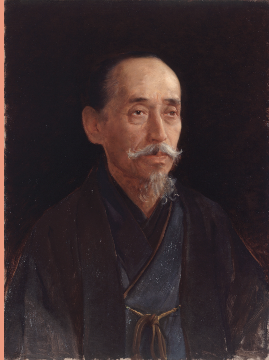
松岡寿 《父の像(松岡隣)》