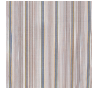
佐藤常子 絵織着物《雪の沢》(部分) 2004年 個人蔵