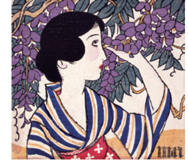
竹久夢二 《婦人グラフ》第3巻第5号 表紙絵 1926年 夢二郷土美術館蔵