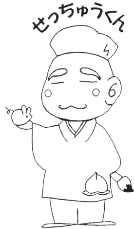
岡山県立美術館キャラクター

2週間に一度、4人程度の当番班で活動します。 活動日は、あなたの希望する曜日を選ぶことができます。 火、水、木、金:10時～16時 土、日:10時～13時・13時～16時 (特別展の時は9時～13時と13時～17時)