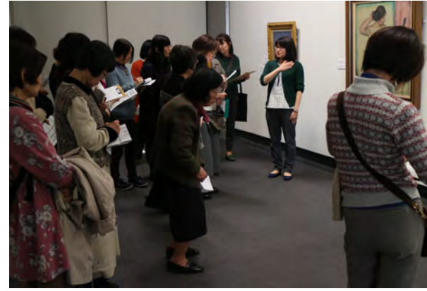
＜ボランティア研修の様子＞