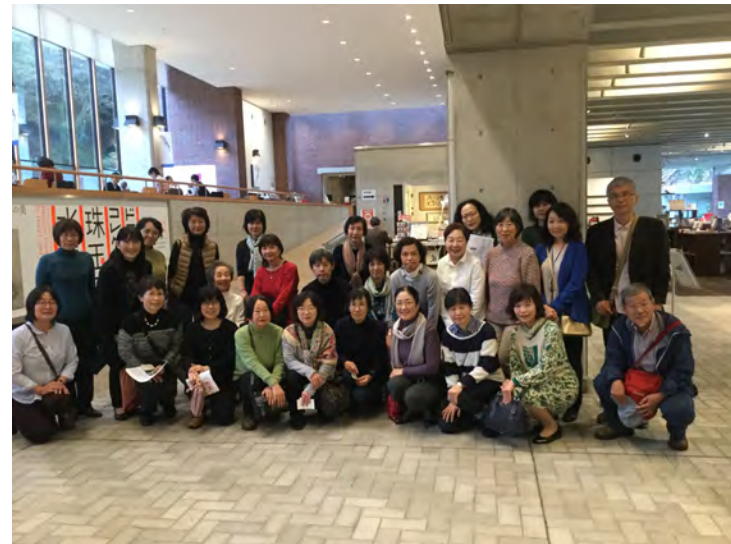
<有志によるボランティア研修旅行>