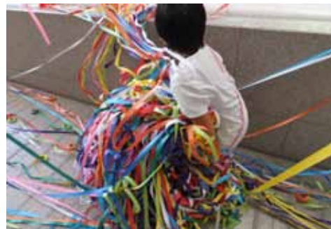
片付けもワークショップ！！