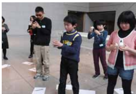
セロテープでボール？！