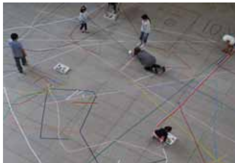
キャンバスは地面！！