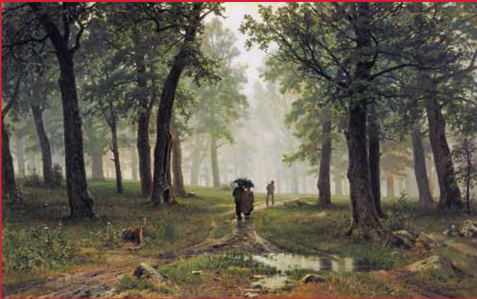
イワン・シーシキン《雨の森林》1891年 油彩・キャンヴァス