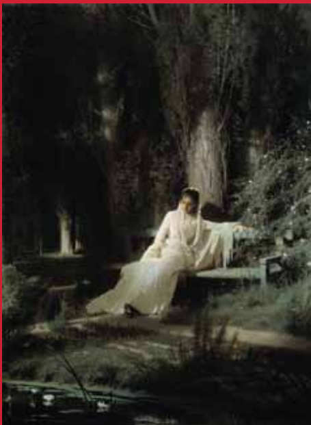
イワン・クラムスコイ《月明かりの夜》1880年 油彩・キャンヴァス