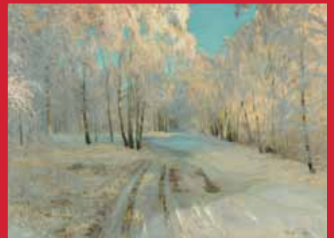
ワシーリー・バクシェーエフ《樹》1900年 油彩・キャンヴァス ©The State Tretyakov Gallery