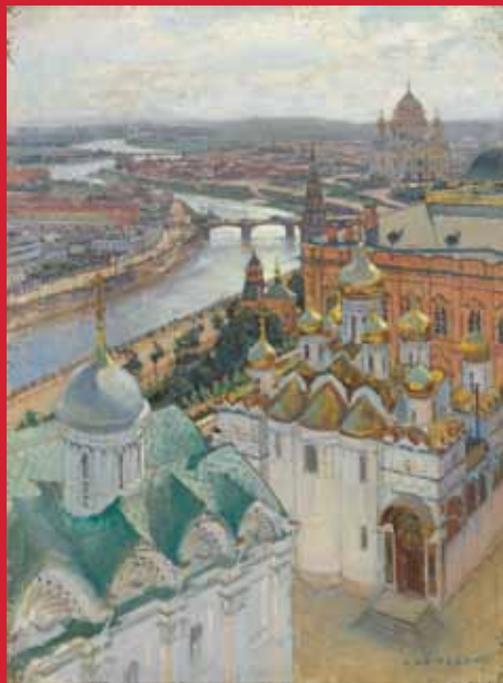
ニコライ・グリツェンコ《イワン大帝の鐘楼からのモスクワの眺望》 1896年 油彩・キャンヴァス