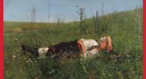
ニコライ・クズネツォフ《祝日》1879年 油彩・キャンヴァス