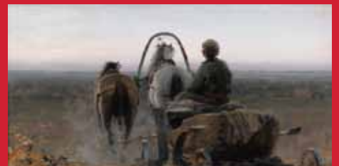
アブラム・アルヒーポフ《帰り道》1896年 油彩・キャンヴァス

モ スクワにある国立トレチャコフ美術館は、創設者パーヴェル・トレチャコフ(1832-1898)によってその基礎が築かれた約20万点のコレクションを有するロシア美術の殿堂です。なかでも19世紀後半から20世紀初頭にかけてロシア各地で移動展覧会を行なった「移動派」のクラムスコイやシーシキン、レーピンといったロシア近代絵画の巨匠たちの作品を豊富に所蔵していることで世界的に有名です。