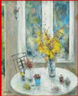
「ハーブスタンドの秋」寺坂公雄(洋)