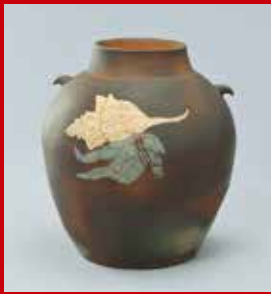
「紫暮の渚壺」今井政之(工)