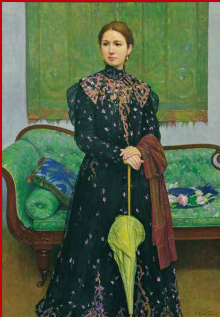
「繡衣立像」中山忠彦(洋)