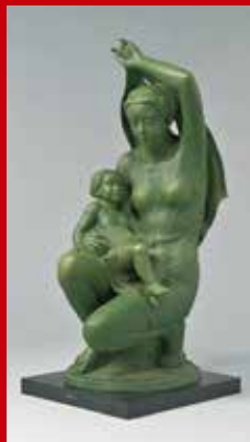
「愛一平成讃歌一」能島征二(彫)