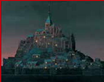
「暮れゆく時」村居正之(日)