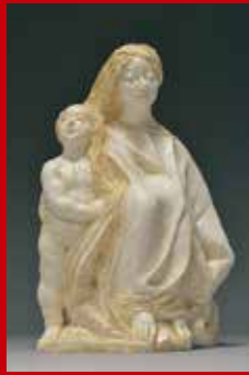
「永日抄2018」蛭田二郎(彫)