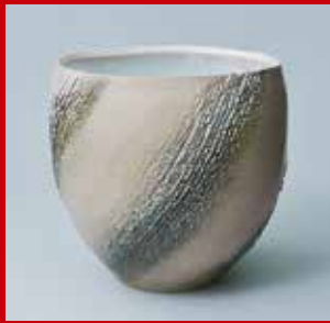
「萩袖陶壺「跡・2018」」吉賀将夫(工)