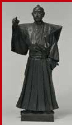
「岩瀬忠震公」中村晋也(彫)