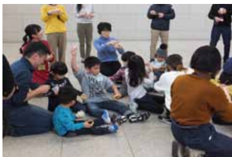
セロテープでボール?!