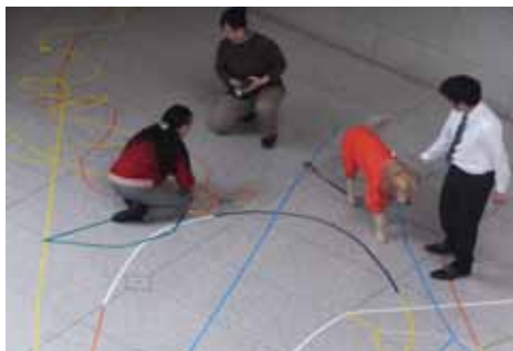
地面がキャンパス!!