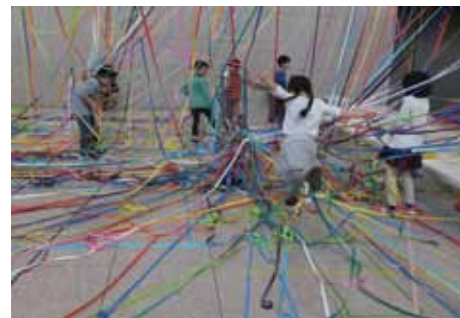
紙テープの中ヘジャンプ?!