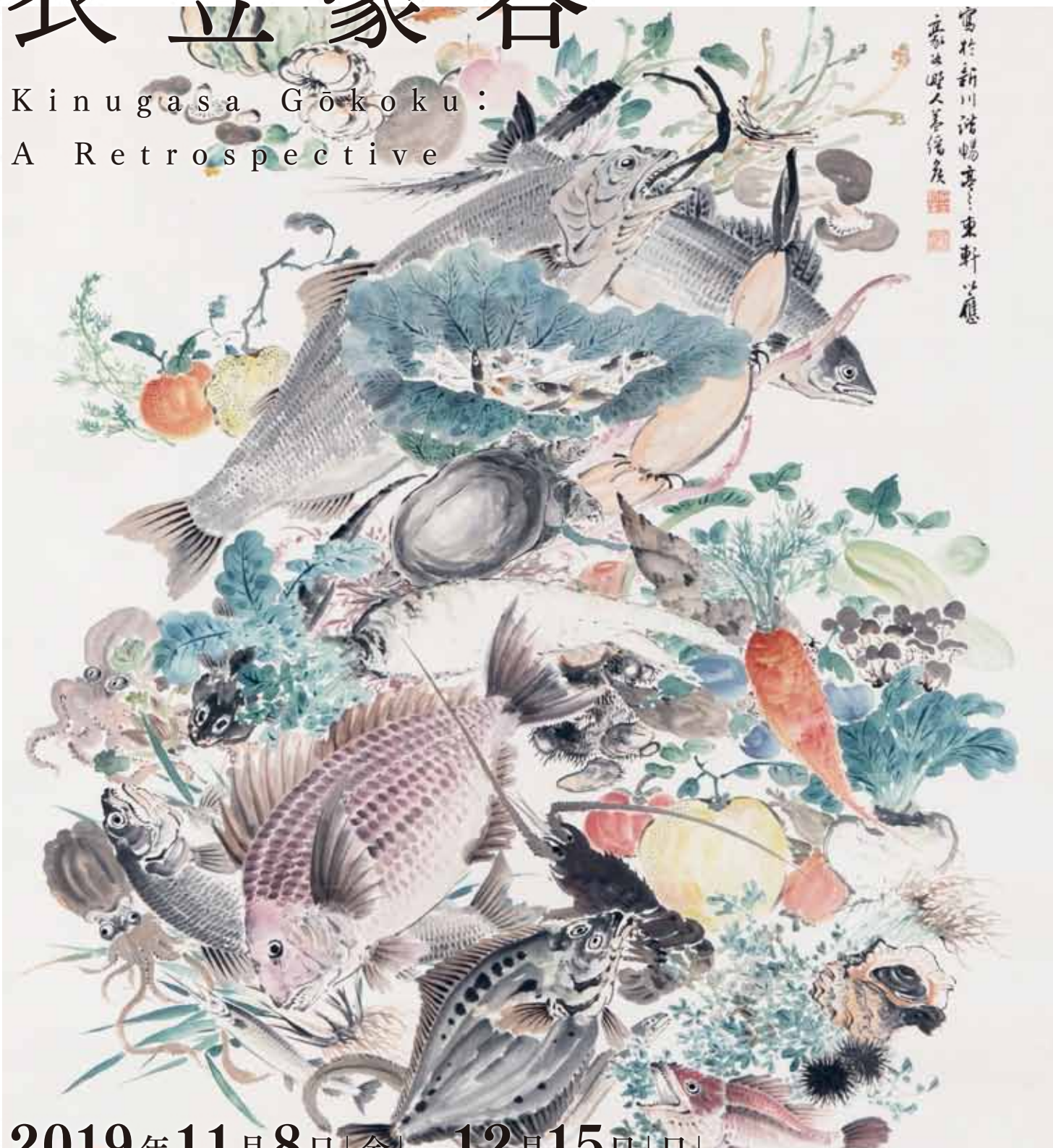
衣笠豪谷(豊肴萬俎旨酒千鐘図)(部分) 1892