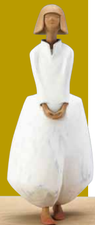
日本工芸会奨励賞 木彫彩色「時」 松崎幸一光