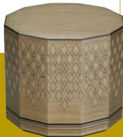
高松宮記念賞 神代杉彩線木象嵌十二角箱 桑山弥宏