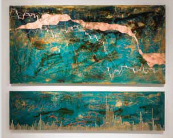
上《As long as the wind blows》2021 下《How I learned to stop worrying and love the bomb》2018