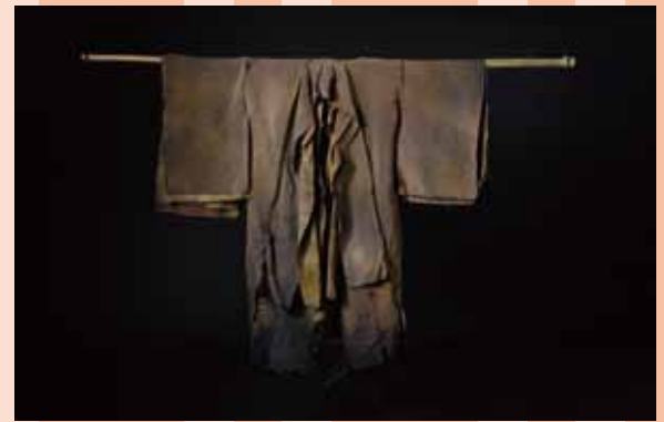
上《渡し舟》(部分) 2022 下《回帰》2022