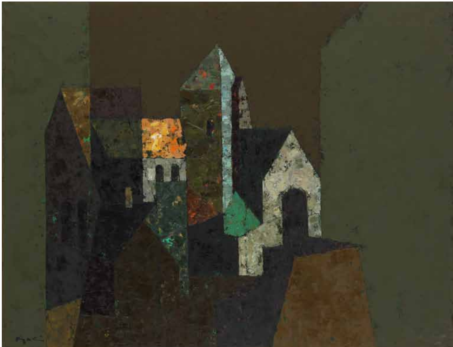
《ロマネスクの寺》1978年 油彩・カンヴァス 岡山県立美術館蔵