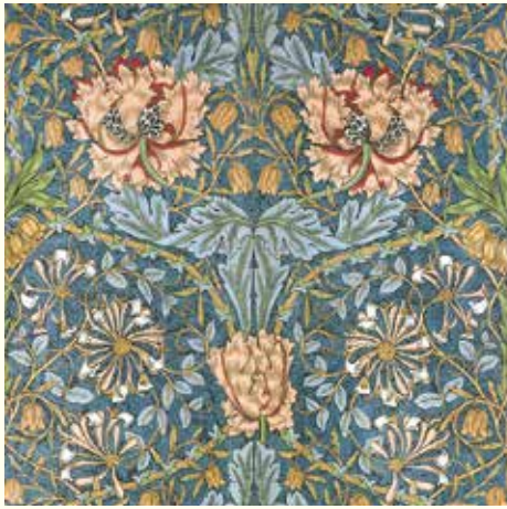
《すいかずら》 デザイン：ウィリアム・モリス、1876年