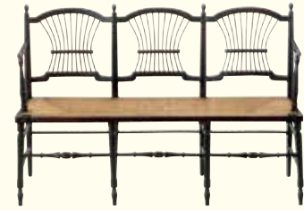
《ロセツアの長椅子》 デザイン… おそろくダンテ・ゲイナリエル・ロセティ、 1863年頃