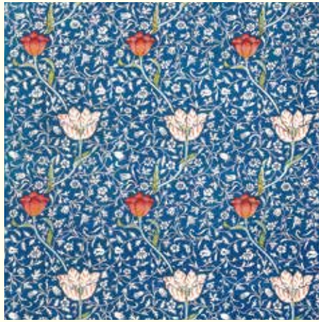
《メドウェイ》 デザイン：ウィリアム・モリス、1885年