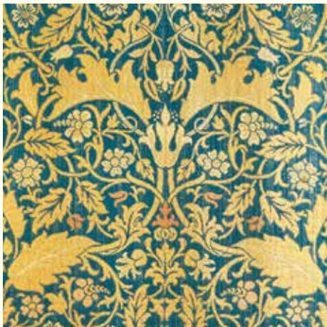
《キャンピオン(なでしこ)》 デザイン：ウィリアム・モリス、1883年