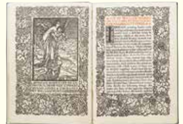
ウィリアム・モリス 「ケルムスコット・プレス設立趣意書」 1898年、ケルムスコット・プレス