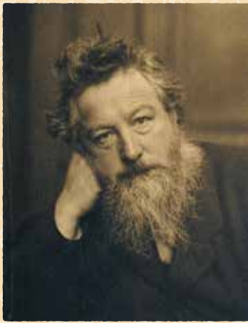
ウィリアム・モリスの肖像写真、1886年頃