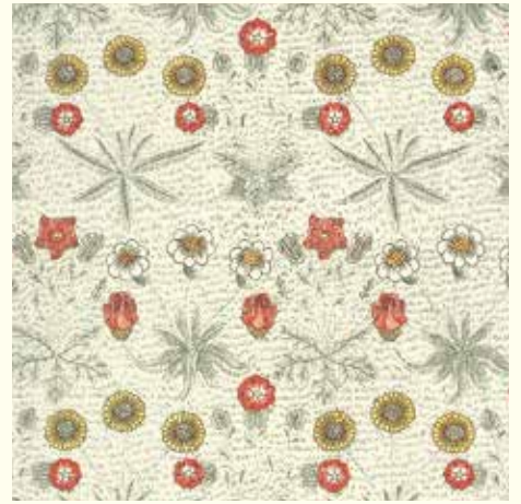
《ひなぎく》 デザイン：ウィリアム・モリス、1864年