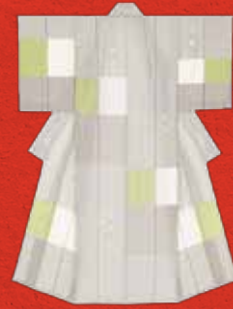
〔日本工芸会会長賞〕 穀織着物 「Garden」 海老ヶ瀬順子

企画協力 | 岡山県立大学デザイン学部工芸工業デザイン学科 日時 | 11月19日(日) 10:00~材料がなくなり次第終了(最終受付16:00) 材料費 | 500円 定員 | 40名(当日先着順) 会場 | 地下屋内広場 * 順番に体験していただきますので、場合によってはお待ちいただくことがあります。