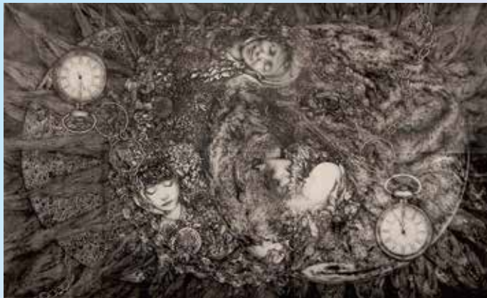
《生命の変容と融合-0への帰帰-》2024