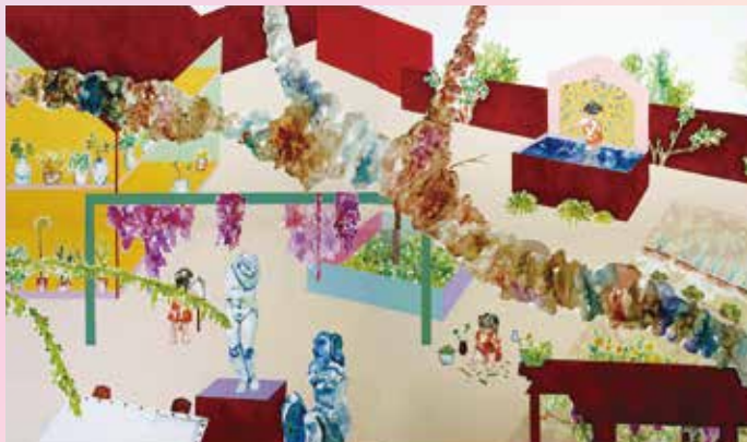
《イブとヴィーナス》2024