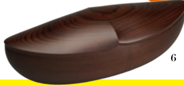
1 日本工芸会奨励賞 友禅着物「汽水城」尾崎久乃 2 日本工芸会保持者賞 銀泥彩磁鬼灯文鉢 井戸川豊 3 日本工芸会会長賞 七宝鉢「律」安藤令子 4 日本工芸会奨励賞 漆絵箱「盛夏」田中義光 5 日本工芸会新人賞 布目象眼五角鉢「滯」藤川耕生 6 日本工芸会新人賞 櫻拭漆蓋物「夕映鯨」松原輝