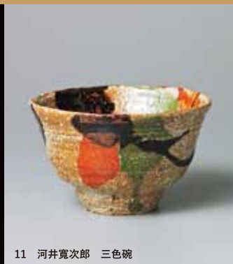
11 河井寛次郎 三色碗