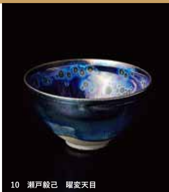
10 瀬戸毅己 曜変天目