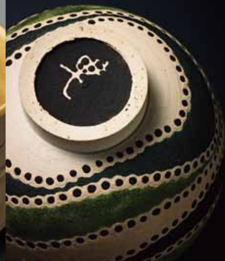
6 加守田章二 茶碗(部分)