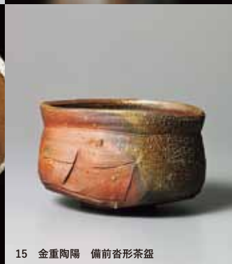
15 金重陶陽 備前杓形茶盃