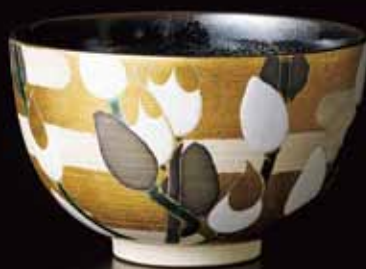
2 楠部彌弼 色絵浅春茶盃