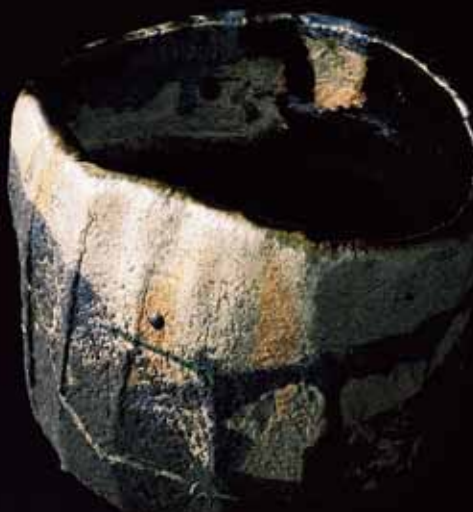
4 十五代 楽吉左衛門 茶盃(部分)