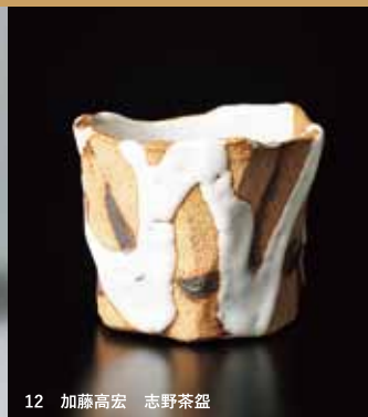
12 加藤宏宏 志野茶盃