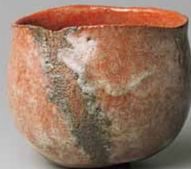
9 山田山庵 巫山峡 三峡之内 霧の澤