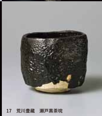
17 荒川豊藏 瀬戸黒茶碗