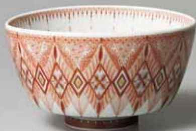
7 見附正康 赤絵細描花紋茶盃