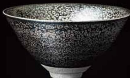
8 清水卯一 鉄羅茶盃