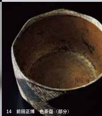
14 前田正博 色茶盃(部分)