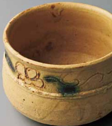
5 加藤唐九郎 黄瀬戸茶盃 銘「早春」(部分)