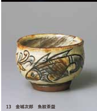
13 金城次郎 魚紋茶盃