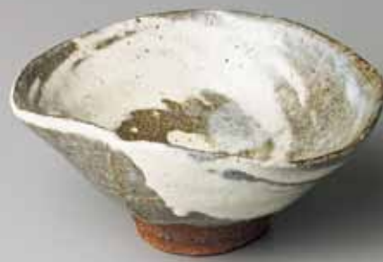
3 川喜田半泥子 高師の浜 八十貫百盃鑑 百碗之内