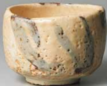
1 岡部嶺男 絵志野茶碗